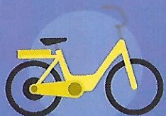
Vélos à assistance électrique