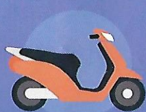
Deux-roues motorisés électriques, y compris scooters à trois roues, à l'exclusion des trottinettes et gyropodes

Seuls les véhicules neufs sont éligibles au dispositif. Location longue durée, leasing... exclus.